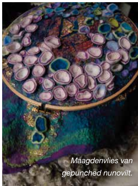
Maagdenvlies van gepunched nunovilt.