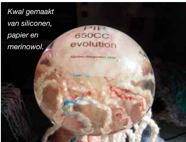
Kwal gemaakt van siliconen, papier en merinowol.