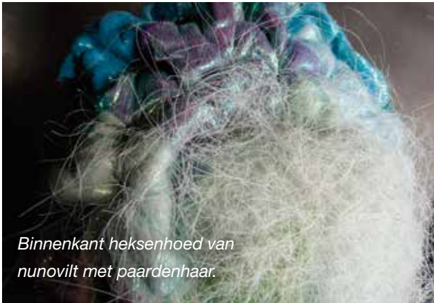
Binnenkant heksenhoed van nunovilt met paardenhaar.