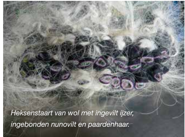
Heksenstaart van wol met ingevilt ijzer, ingebonden nunovilt en paardenhaar.